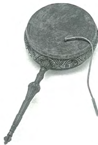
Nombre: Rnga Procedencia: Nepal Tipo: Tambor con marco