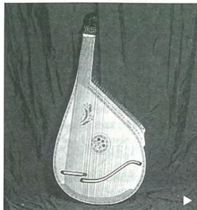
Nombre: Bandura Procedencia: Ucrania Tipo: Cítara de caja