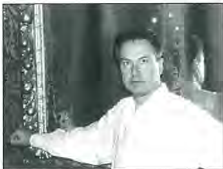
ENRIQUE PÉREZ DE GUZMÁN Piano

Madrileño de nacimiento, comienza su brillante carrera internacional tras su paso por el Real Conservatorio de Madrid, destacando su estancia en París, donde conoce a muy importantes figuras del pianismo mundial y gana los premios internacionales de Salzburgo y Bucarest, que le han llevado a actuar en los cinco continentes, tanto en recital como en calidad de solista, invitado de las principales orquestas del mundo. Su amplio repertorio le permite abordar los más diversos estilos y técnicas pianísticas con la misma facilidad, resaltando su especial interés en el periodo romántico, impresionismo francés y en la música española.