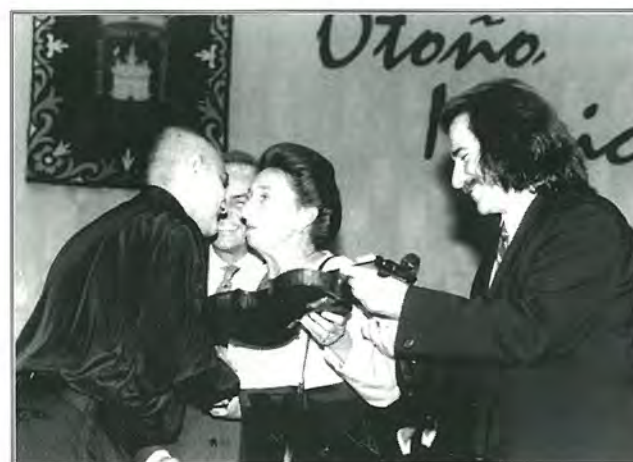
Entrega del II Violín "Ciudad de Soria" en la pasada Edición