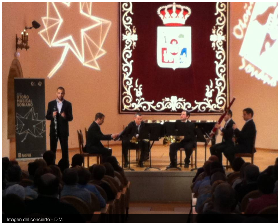
Imagen del concierto - D.M.