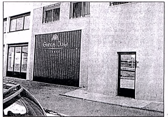
Gráficas Ochoa, una de las empresas afinada en Soria.

La jornada contará con la presencia de los dos ministros sorianos de Administraciones Públicas y