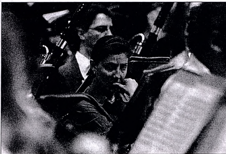
Un momento del ensayo del concierto inaugural del Otoño Musical Soriano, ayer en la Audiencia.

El director musical del festival soriano hizo un repaso de las actuaciones que se desarrollarán durante los fines de semana hasta el próximo 7 de octubre. Así, destacó la actuación del Orfeón Donostiarra, "ya que se trata del grupo co-