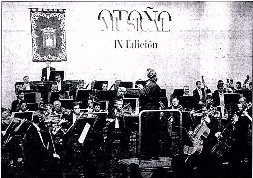
La Orquesta Sinfónica de Castilla y León deleitó al público en la última actuación del Otoño Musical Soriano

Como ha venido siendo habitual a lo largo del festival, que comenzó el pasado 14 de septiembre, numeroso público se congregó en el Centro Cultural Palacio de la Audiencia para asistir a este último concierto, después de que el Ayuntamiento de Soria tuviera que aplazar el estreno de la obra encargada del festival, de Leonardo Balada, Dionisio Ridruejo . In memoriam, debido a problemas técnicos.