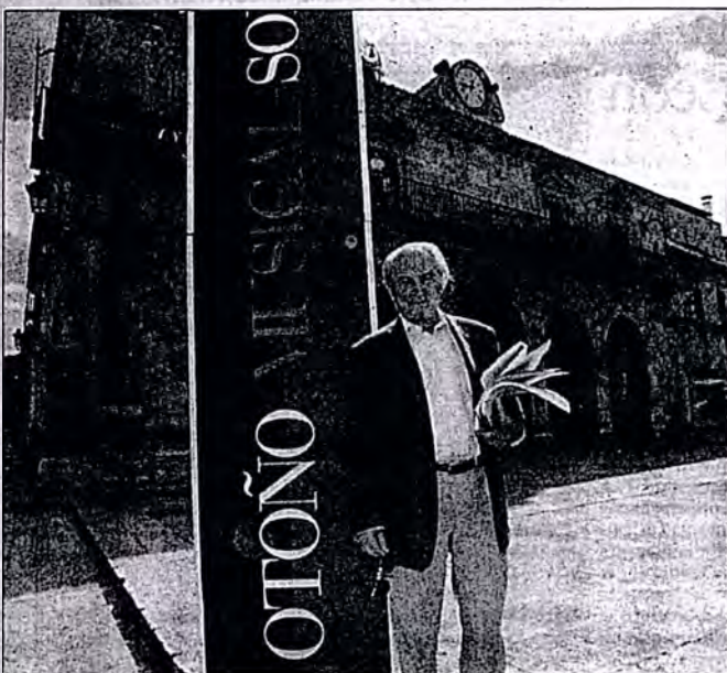
El maestro Odón Alonso destaca el nivel de la programación en el festival

su libro Escrito en España , cuya circulación se prohibió en el país. Estuvo exiliado en París entre 1962 y 1964, y vivió también en Roma y Estados Unidos. Murió en una clínica madrileña de una angina de pecho en 1975, asistiendo a su entierro personas de evidente significación antagónica. Se dijo entonces que había sido el hombre de la mano tendida.