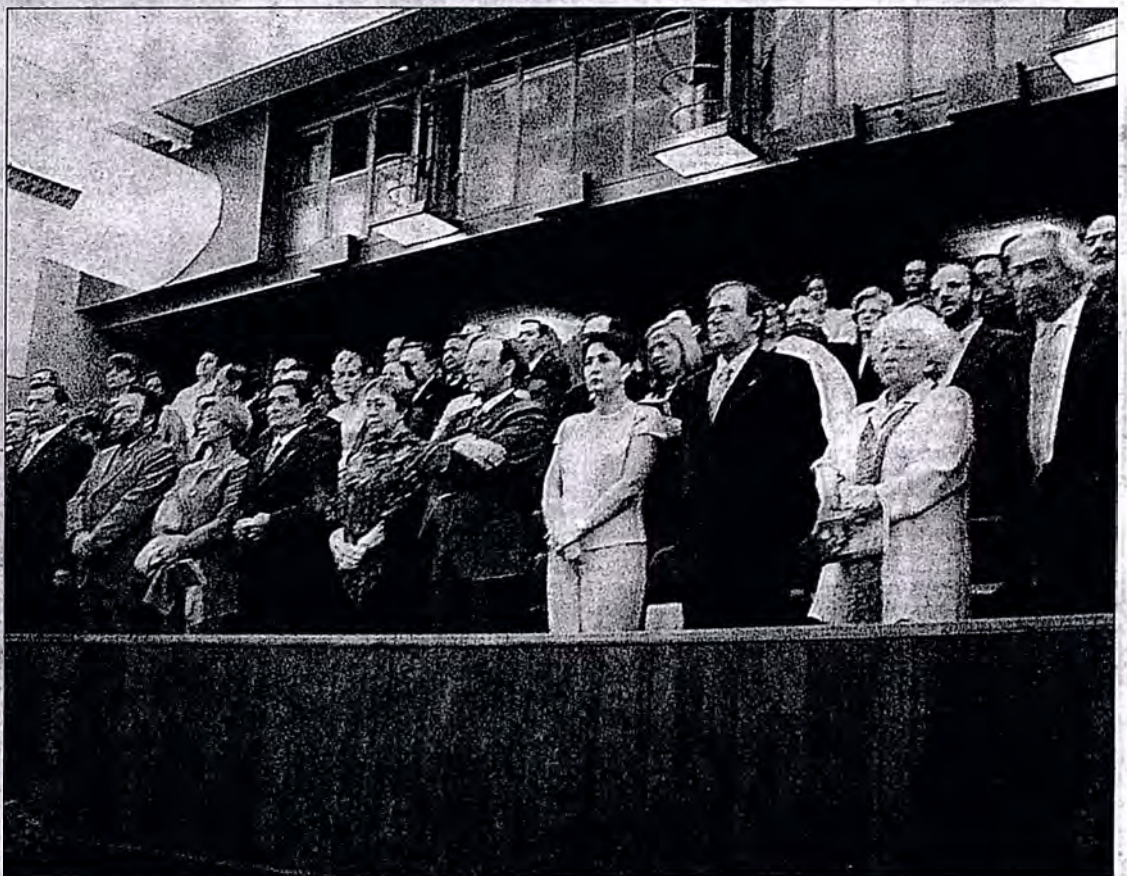
El Otoño Musical Soriano abrió su primera velada guardando unos minutos de silencio por las víctimas del atentado de Nueva York

Santiago Botero es el nuevo líder de la Vuelta Ciclista a España