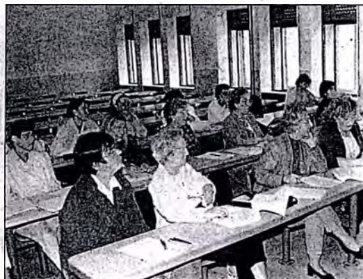
Imagen de la última reunión de la plataforma

La plataforma estará integrada por 20 asociaciones y abierta en todo momento a la adhesión de otras muchas interesadas, según apuntó el portavoz. Entre sus objetivos, destacan las labores de promover el voluntariado en Soria, coordinar acciones conjuntas y fomentar el intercambio de experiencias entre las asociaciones integrantes, ofrecer información a entidades y ciudadanas sobre las diferentes actividades