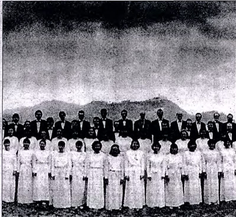
Imagen del Orfeón Donostiarra, que ofrecerá dos conciertos en el Otoño Musical Soriano