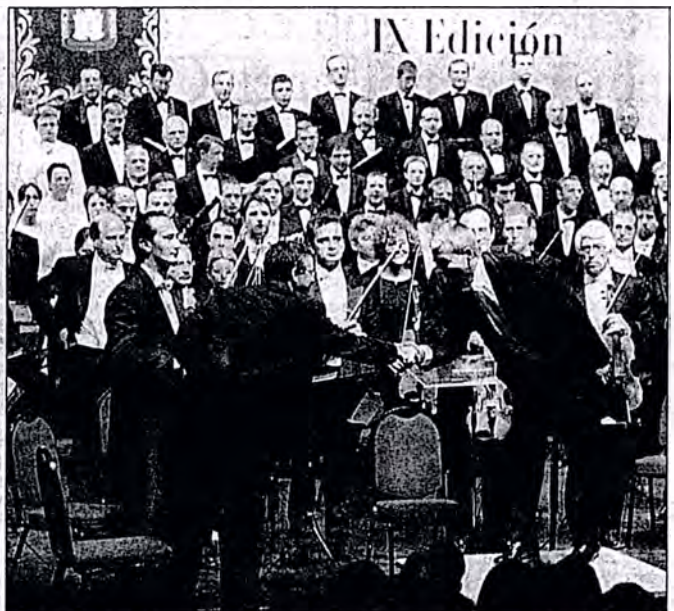
f.s. La gran calidad del concierto refleja el éxito de público