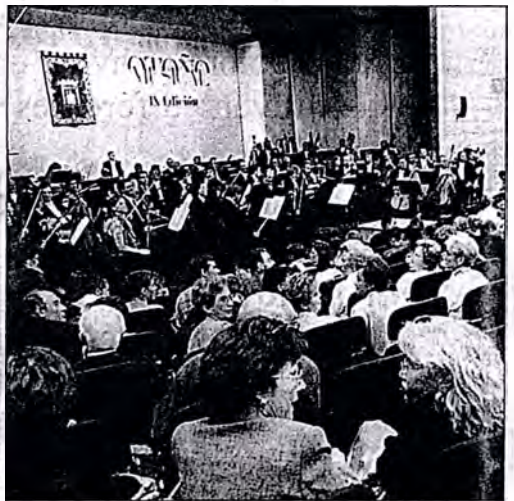
El público soriano abarrotó el Palacio de la Audiencia