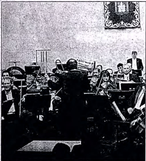
Los sorianos disfrutaron de un excelente concierto

El miércoles los sorianos gozamos, una vez más, de lo que es la buena música; la mejor.