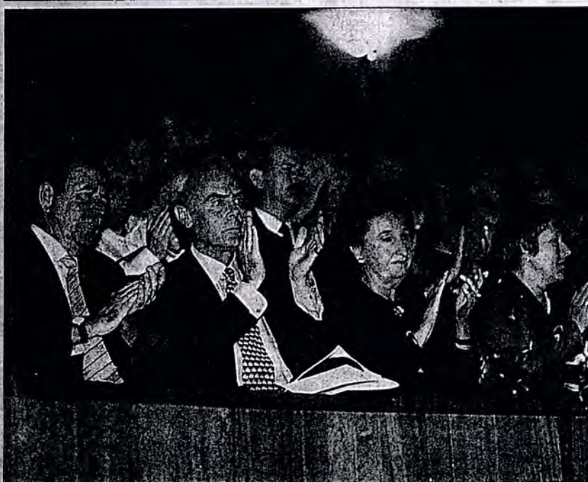
Los Duques de Soria presidieron el concierto, en el que se interpretaron piezas de Falla

En la actualidad, sólo existen en la capital, Ólvega y El Burgo de Osma PÁG. 7